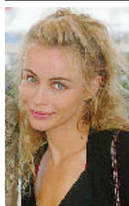
Emmanuelle Béart L'attrice ha fatto suo il motto: «Non ci sono persone nate sotto una cattiva stella, ma gente che non sa leggere il cielo»