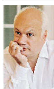
Eric-Emmanuel Schmitt Scrittore francese in «Odette Toutlemonde» dedica un capitolo a un «bel giorno di pioggia»

Un principio, questo, che ha arruolato nell'associazione stelle del cinema francofono come Emmanuelle Béart e Emilie Dequenne. Ma anche uno scrittore di grido come Eric-Emmanuel Schmitt - che nel suo frizzante Odette Toutlemonde ha intitolato un capitolo, il secondo, «Un beau jour