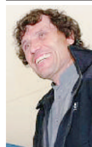
Alain Hubert Esploratore belga e ambasciatore dell'Unesco vuole risolvere col pensiero positivo i gravi problemi ambientali

de pluie» - e il cioccolato più richiesto ed esoso del momento, Pierre Marcolini.