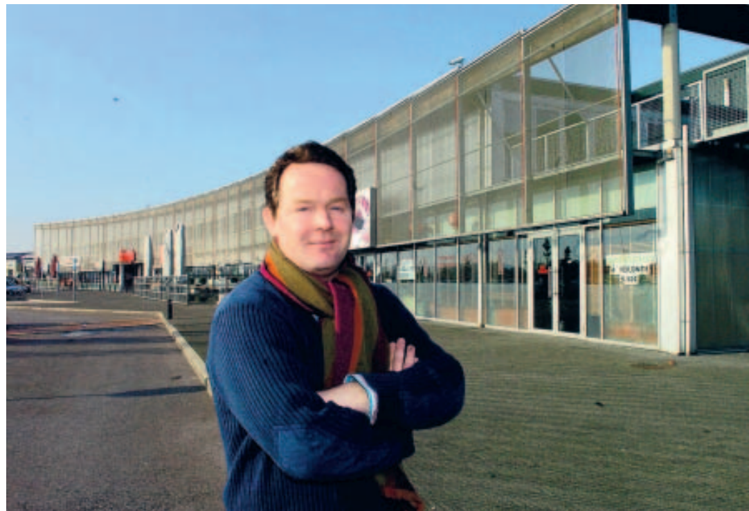
La première action de la ligue des optimistes se tiendra ici, à Imagix. ■ E.G.

À NOTER Site internet: www.liguedesoptimistes.be. Contact Hainaut: ederwael@imagix.be, 0475/64.90.26.