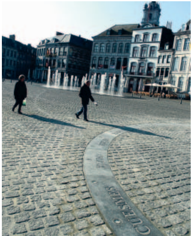
Avec les noms des 19 communes de Mons. ■ EG

L'anneau en pierres bleues symbolisant l'arène du combat dit Lumeçon, sur la Grand'Place de Mons, est terminé. Une œuvre tout à fait symbolique qui rappelle le Doudou aux passants.